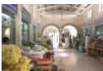
In Al Dhaid

Dort schlenderten wir noch durch die Einkaufsstraße – kein Vergleich mit Dubai, aber auch nicht schlecht. Im Gold-Souq von Ajman holten wir dann noch die Kette ab, die wir drei Tage vorher in Auftrag gegeben hatten.