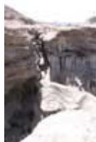
Schlucht bei Hadf