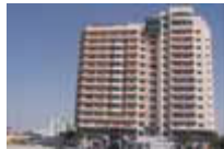
Hotel Coral Suites