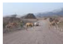
Halt! - Kamele