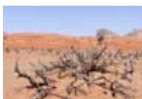
Fossilien-Berg bei Mileiha