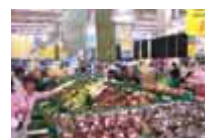
Deira Shopping Center