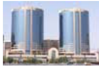
Panorama vom Dubai-Creek aus